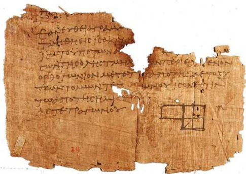
Папирус с древнеегипетским математическим текстом

Делали папирус из стеблей тростника, растущего по болотистым берегам главной реки Египта – Нила. Стебли тростника очищали от коры, разрезали вдоль, смачивали в