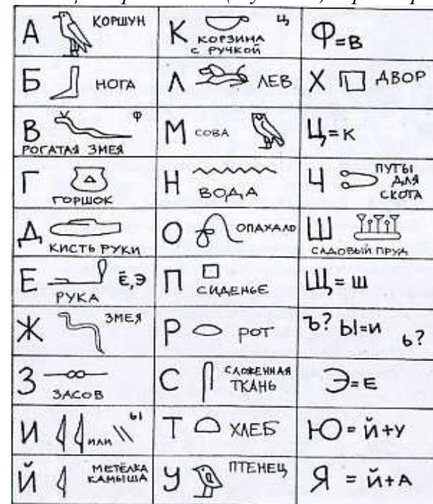
Таблица алфавитных (звуковых) иероглифов